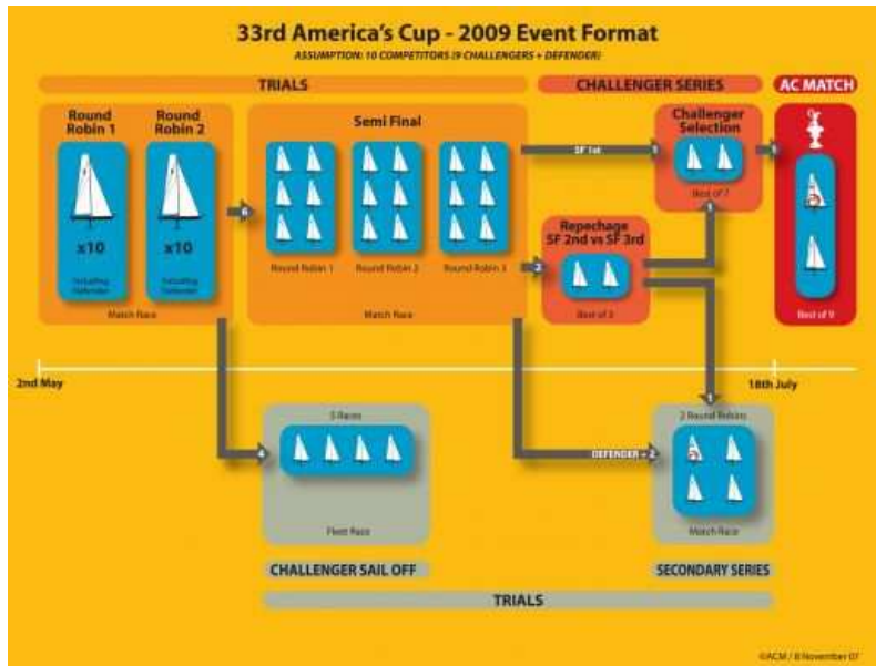
Event format table