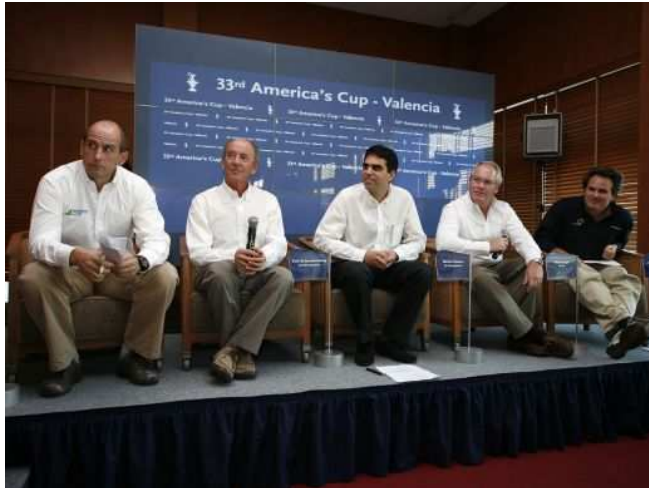
Presentation of the Competition Regulations and AC90 Class Rule for the 33rd America's Cup Press Conference.

sur le format de la compétition. Le processus de consultation fut très intense, en ce qui concerne Emirates Team New Zealand, avec de longues nuits passées au téléphone pour entendre les différents points de vue, asseoir les positions de chacun et donner notre avis. Ce fut un processus très stimulant et nous comprenons le besoin d'avancer rapidement pour permettre l'organisation de la régates en 2009.”